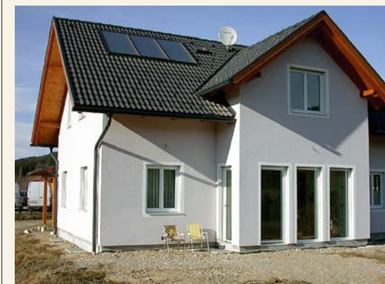
Eksempler på passivhus-byggeri i Europa